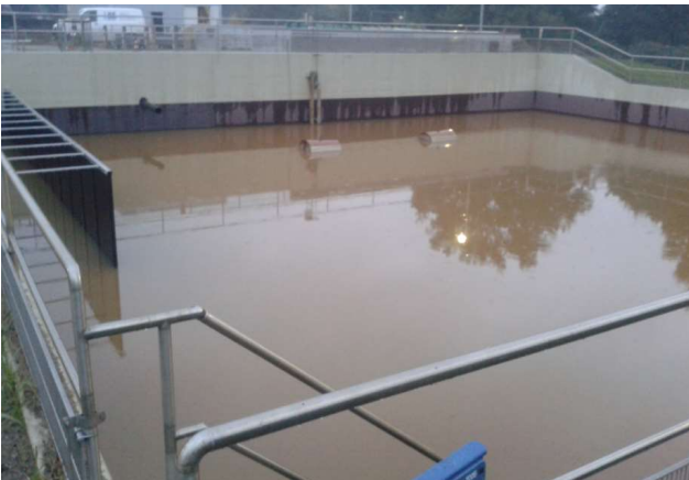
Vor der OLOID-Installation

Der OLOID Typ 600 I sorgt für die notwendige Homogenisierung im Becken, so dass sich keine Feststoffe (vor allem Eisen) absetzen.