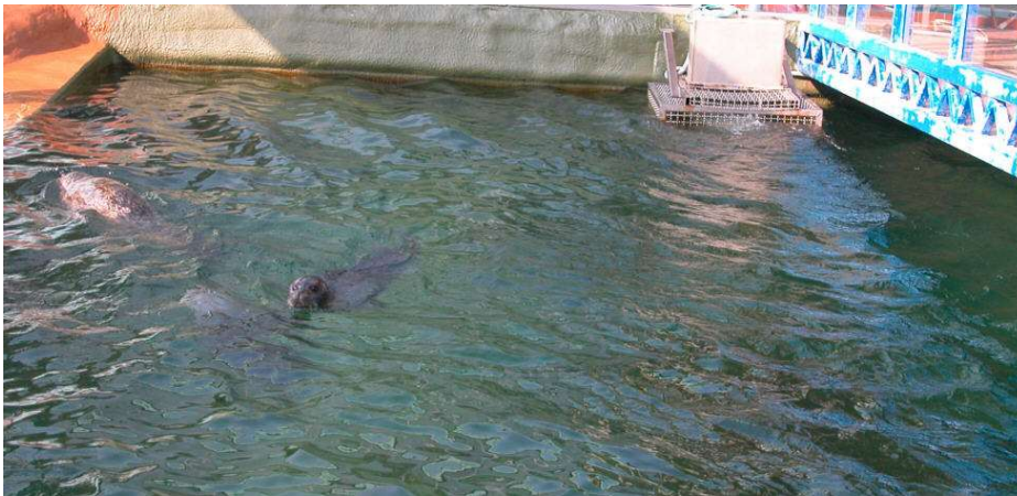
Seehundbecken mit oloidalem Wellenmuster, OLOID Typ 600 rechts am Beckenrand.

Tiere: 3 Seehunde haben Gesellschaft von verschiedenen Krabben. Dank der guten Strömung bedeckt Sand den Beckenrund.